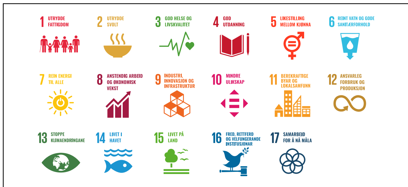
FN sine berekraftsmål 62